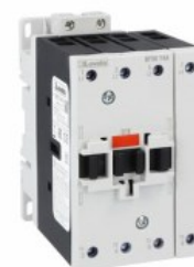
Stycznik mocy BF50